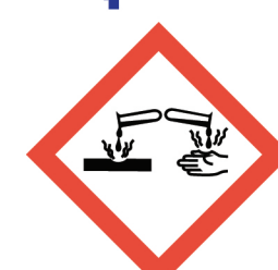
สารกัดกร่อน