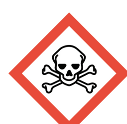
พิษเฉียบพลัน