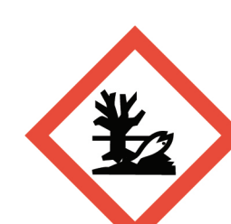
อันตรายต่อ สิ่งแวดล้อม