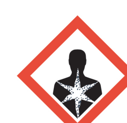
อันตราย ต่อสุขภาพ