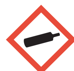
ก๊าซบรรจุ ภายใต้ความดัน