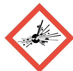
วัตถุระเบิด