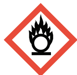
สารออกซิไดซ์